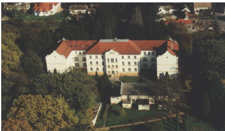
Csokonai Vitéz Mihály Református Gimnázium, Általános Iskola és Kollégium