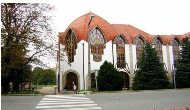
Csokonai Vitéz Mihály Községi Ház